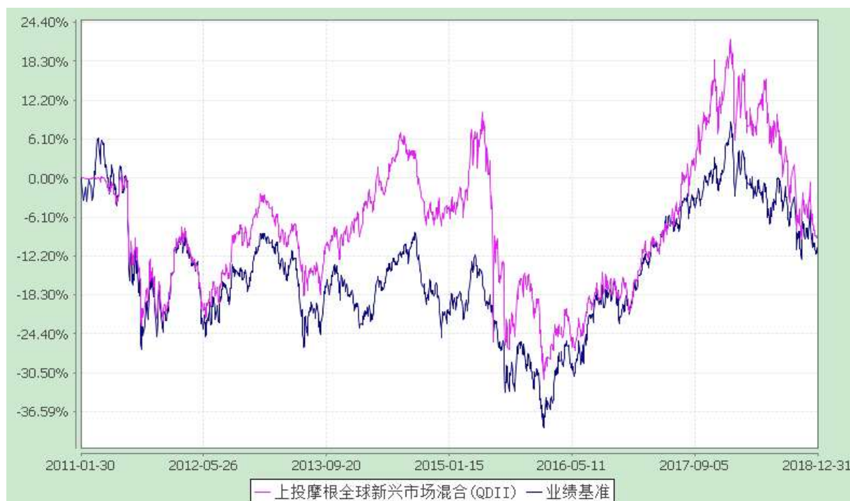
上投摩根全球新兴市场混合型证券投资基金 自基金合同生效以来份额累计净值增长率与业绩比较基准收益率历史走势对比图 (2011 年 1 月 30 日至 2018 年 12 月 31 日)

注：本基金合同生效日为 2011 年 1 月 30 日，图示时间段为 2011 年 1 月 30 日至 2018 年 12 月 31 日。