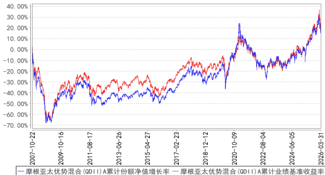
摩根亚太优势混合(QDII)A累计份额净值增长率与同期业绩比较基准收益率的历史走势对比图