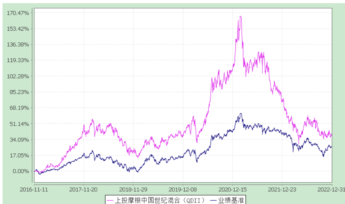
上投摩根中国世纪灵活配置混合型证券投资基金（QDII） 自基金合同生效以来份额累计净值增长率与业绩比较基准收益率历史走势对比图 (2016 年 11 月 11 日至 2022 年 12 月 31 日)

注：本基金合同生效日为 2016 年 11 月 11 日，图示的时间段为合同生效日至本报告期末。