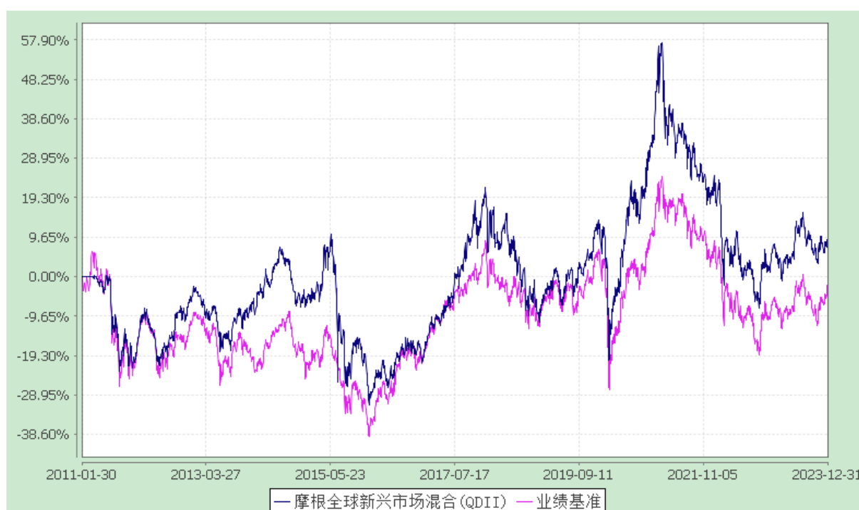
摩根全球新兴市场混合型证券投资基金(QDII) 自基金合同生效以来份额累计净值增长率与业绩比较基准收益率历史走势对比图 (2011年1月30日至2023年12月31日)

注：本基金合同生效日为2011年1月30日，图示的时间段为合同生效日至本报告期末。